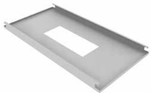
Aberturas simples em formato quadrado ou retangular